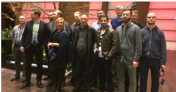
BSB's ledere på på Solidarność museet