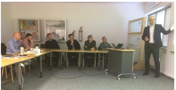
CFO'en fortæller om FutEx og motivation