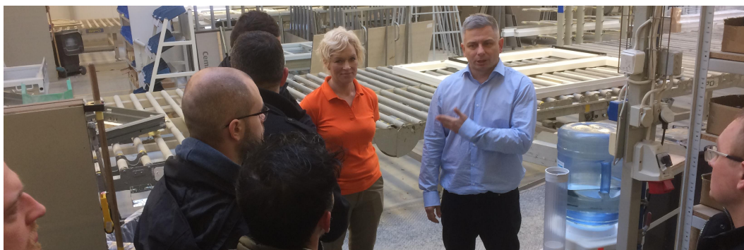
En medarbejder og den administrerende direktør fortæller om "10+1", der er inspireret af et Scania besøg